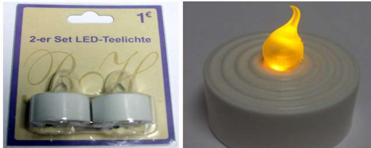
Teelicht Verkaufspackung und eingeschaltetes Teelicht mit Gummizipfel über der LED

Bei einem Stammtischabend brachte ein Kollege elektronische Teelichter mit. Diese werden in verschiedenen „Billig-Läden“ oft für 1 Euro im Doppelpack angeboten. Diese bestehen aus einem Gehäuse, Ein- Ausschalter, 3 Knopfzellen, LED und einem Zipfel aus Gummi dass wie eine Flamme aussieht.