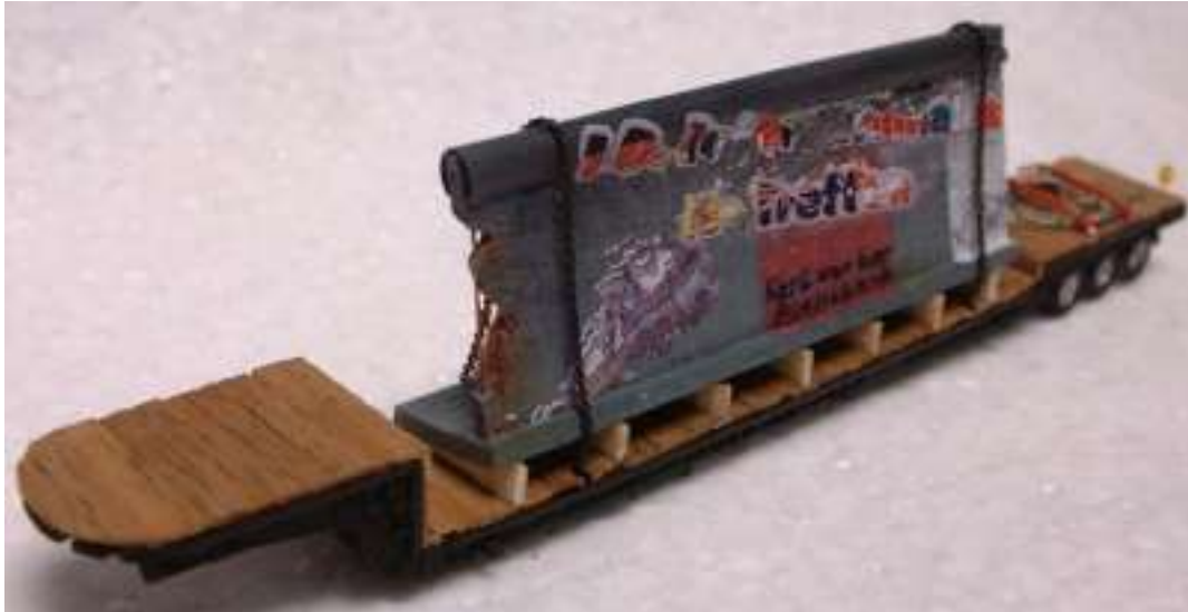
Die Mauer wurde mit Ketten auf den Wagen befestigt ...