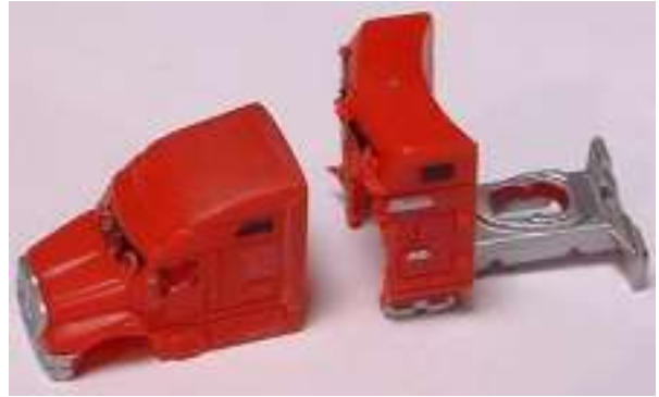
Micro Machines Modell, das Fahrgestell und die große Schlafkabine wurden entfernt