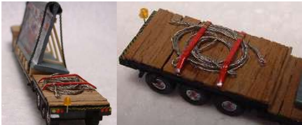
Eine Rundumleuchte und die Drahtseile zur Entladung am Zielort wurden noch angebracht