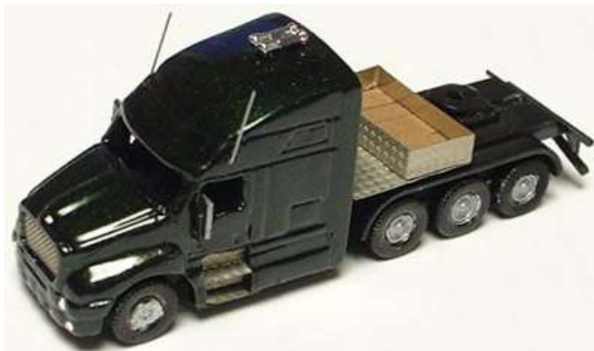
Trittstufen, Riffelblech, Spiegel, Antenne, Kühlergrill, Fanfare und Materialkiste mit Echtholzboden angebaut ...