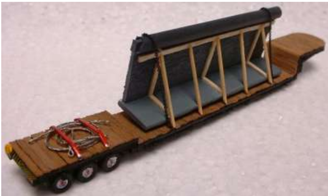
... von hinten wird das ganze durch ein Holzgestell gestützt