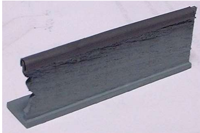
Zwei Holzbrettchen und ein Stück Schrumpfschlauch bilden das Grundmodell

Die Szene stellt den Schwertransport der „Berliner Mauer“ auf den Straßen der USA dar. Die Mauer selber wurde aus Holzleisten hergestellt. Die Abschlussröhre auf der Mauer ist ein Stück Schrumpfschlauch.