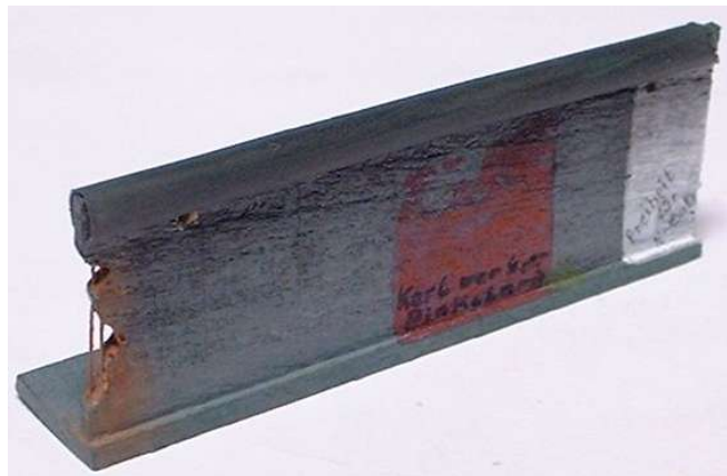
Eingebrachtes Moniereisen ein wenig Rostfarbe und diverse Kritzeleien verschönern die Mauer

Das Moniereisen, welches an manchen Stellen zu sehen ist, wurde einfach mit dünnem Draht dargestellt. Der Mauertyp stellt die 4. Generation der Berliner Mauer dar (offizieller Name: Stützwandelement UL 12.11).