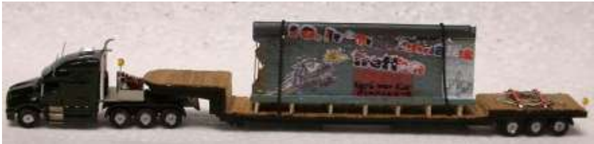
Hier das Modell von der anderen Seite