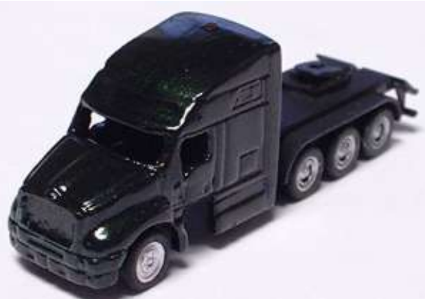
Fenster usw. wurden ausgehöhlt, ein neues Fahrwerk eingebaut und das Modell neu lackiert